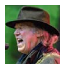
Der Musiker Neil Young.

Die Geräte der ersten Serie sollen im Oktober für 399 Dollar auf den Markt kommen, für frühe Geldgeber bei Kickstarter sind es 300 Dollar. Young kritisiert seit Jahren, dass die Musik für die Nutzung in Musikplayern und Smartphones drastisch herunterge-