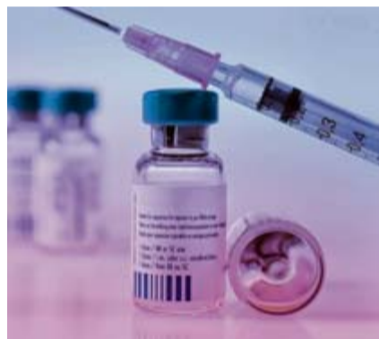
In manchen Impfstoffen ist Aluminium als Verstärker enthalten.