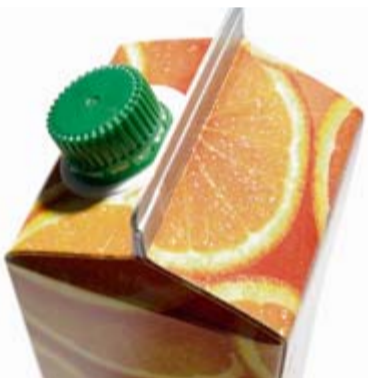
Aluminium bildet eine Zwischenschicht in Tetrapak-Tüten.

Diese schützende Schicht wird durch Säuren abgelöst. Deshalb sollte man es vermeiden, säurehaltige Lebensmittel länger in Aluminiumtöpfen aufzubewahren oder darin saures Obst oder Gemüse wie Rhabarber einzukochen. Bewahren Sie keine Lebensmittelreste in Alufolie auf. Besser geeignet sind Glasschüsseln oder ausgediente Marmeladengläser. Achten Sie darauf, dass darin gelagerte Lebensmittel nicht mit deren Deckeln in Berührung kommen. Das tägliche Vesper lieber in Butterbrot-papier als in Alufolie einwickeln – oder in eine Brotbox aus einem hochwertigen Kunststoff (Polypropylen oder -Ethylen, kein Polystyrol). ► Alternativen in der Kosmetik: Antitranspirantien mit Alusalzen sollte man nur gelegentlich verwenden (etwa bei einem Vorstellungsgespräch oder einem wichtigen Termin). Schauen Sie auf die Deklaration: Wenn von Aluminium die Rede ist, sind Aluminiumsalze enthalten. Auch die vermeintlich so natürlich wirkenden Alaun-Kristalle aus dem Bioladen enthalten Aluminium-Salze. Auch die großen Kosmetik-Konzerne bieten inzwischen Deos ohne Alu an. Deos mit Zink wirken nicht so stark, belasten aber den Körper weniger. Naturkosmetik rückt dem Schweißgeruch mit Salbei, Teebaumöl oder Farnesol zu Leibe. Nachteil all dieser Deos: Sie halten nicht so lange. Da müssen am Abend eventuell noch einmal Wasser und Seife ran. Und: Auch vermeintlich harmlose Naturstoffe können Allergien auslösen. (bea)